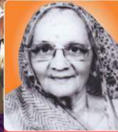
પૂ. રતન મા