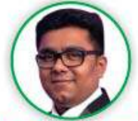
રિષભ છેડા (ર. ગણેશવાલા) ફોટોગ્રાફી ડાયરેક્ટર