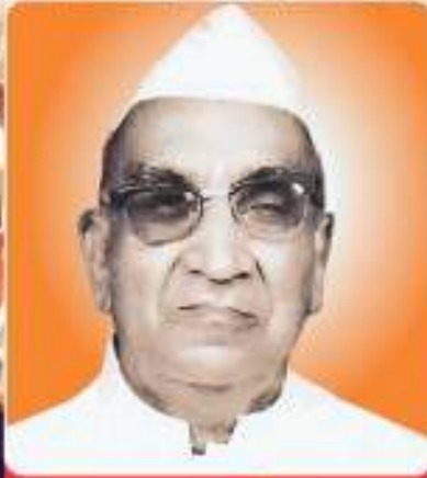
પૂ. લખમશી બાપા

કચ્છ : નવાવાસ • મુંબઈ : કેમ્પસ કોર્નર/માટુંગા